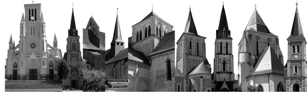
Longué Jumelles La-Lande-Chasles St-Philbert-du-Peuple Blou Mouliherne Vernantes Vernoil-le-Fourrier Courléon