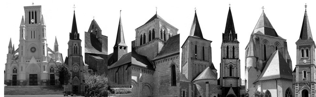
Longué Jumelles La-Lande- St-Philbert- Blou Mouliherne Vernantes Vernouil-le-Fourrier Courléon Chasles du-Peuple